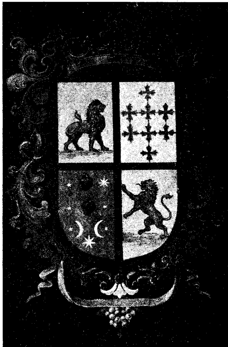
Escudo de armas usado por la familia Villaseñor-Cervantes, de Celaya.